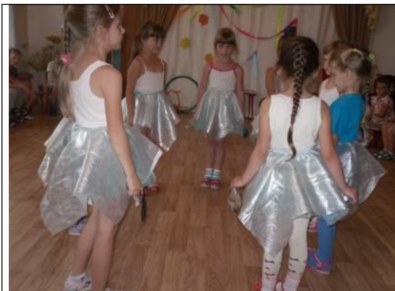
Танец «Капельки». День знаний в детском саду