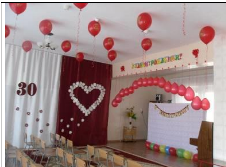
Все готово к юбилею