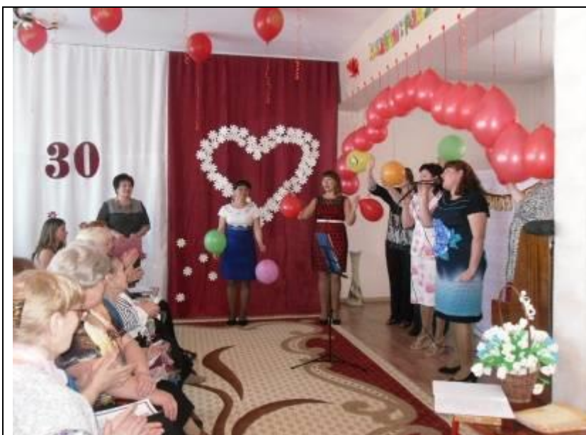
Песня в подарок коллегам