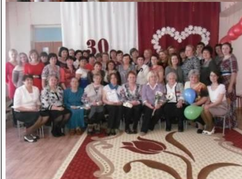
Фотография на память о юбилее