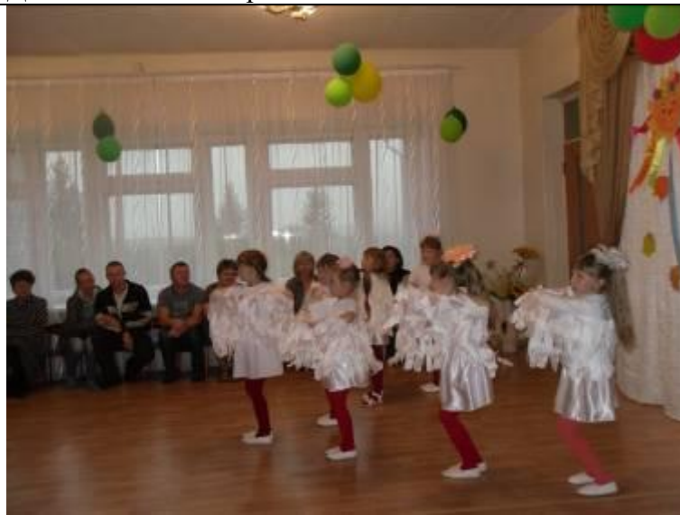
«Аист на крыше» . Концерт для родителей