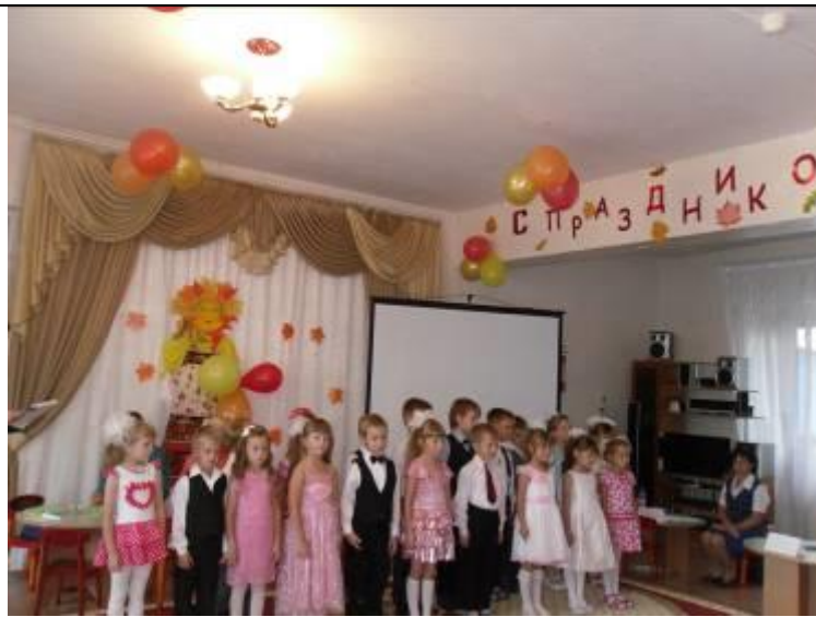
День дошкольного работника